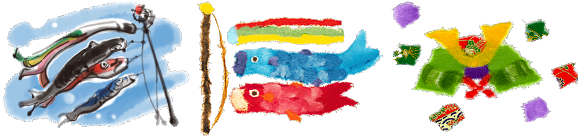
ねんせい はっぴょう 1年生の発表