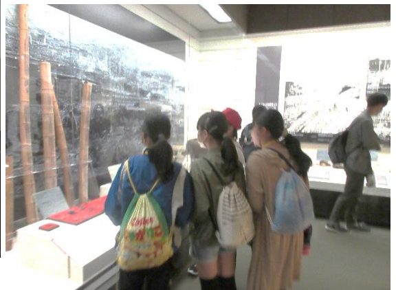
げんぱくしりょうかんでんじけんがく 原爆資料館展示見学